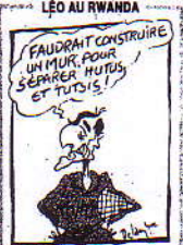
LEO AU RWANDA