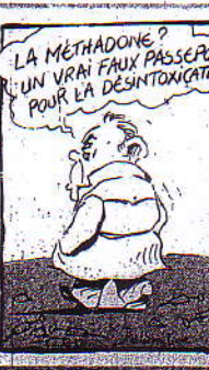
LA MÉTHADONE? UN VRAI FAUX PASSERAIT POUR LA DESINTOXICATION