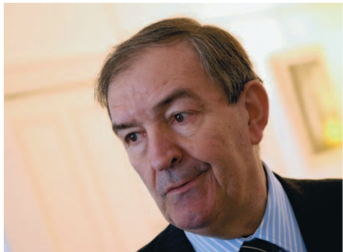
LE JUGE BRUGUIÈRE a lancé un mandat d'arrêt contre le président rwandais. Mais l'un de ses témoins clés affirme au « Soir » qu'il a été abusé.