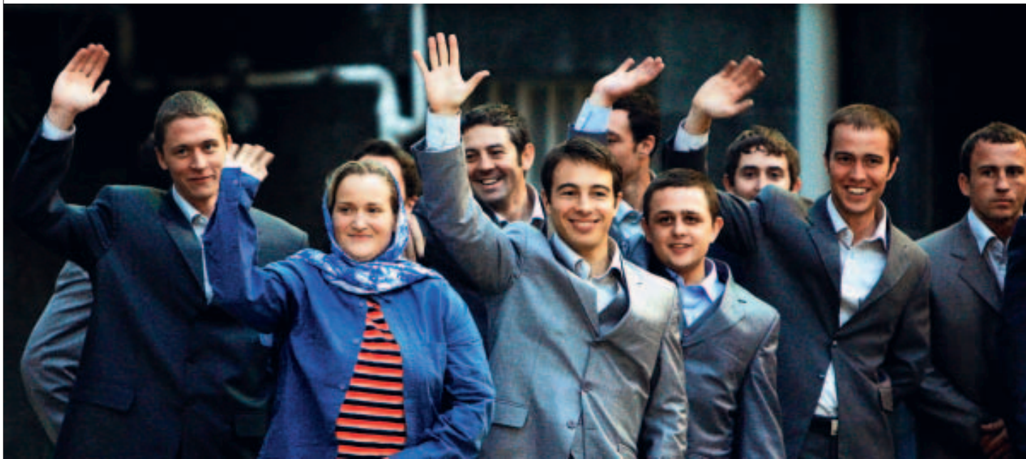
P.9 ORCHESTRÉE de main de maître par le président iranien, la libération des quinze militaires britanniques retenus à Téhéran a donné lieu à une incroyable mise en scène. Ils rentrent à Londres et Ahmadinejad triomphe.