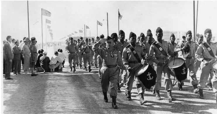
Célébrations à Nouakchott en 1960 après la proclamation de l'indépendance