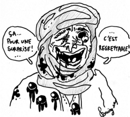
RÉPRESSION DE LAÂYOUNE - POSITION OFFICIELLE DES SAHRAOUI-

En réalité, les autorités congolaises craignaient que la justice internationale identifie les responsables de la tuerie, d'où l'abandon opportun de la procédure devant la CIJ.