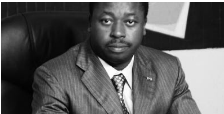
Le président togolais Faure Gnassingbé a succédé à son père en 2005 à l'issue d'un putsch électoral réédité en mars 2010

Le peuple togolais espère sans doute profiter des changements géopolitiques dans la Communauté économique des Etats de l'Afrique de l'Ouest qui mettent l'accent sur la démocratisation, malgré les crises et les compromissions. L'élection présidentielle de 2010 avait réveillé les espoirs de voir une opposition l'emporter quand, ailleurs, les dictatures empêchent facilement les démocrates de s'organiser. Les fraudes ont eu raison de ces espoirs mais le rapport de force s'est équilibré. Les manifestations de l'Alliance nationale pour le changement (ANC) se font régulièrement chaque samedi à Lomé. Des élections législatives sont prévues avant la fin de la législature le 14 octobre. La fraude de l'élection présidentielle s'étant principalement faite au niveau de la centralisation des