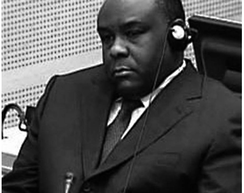
Ancien candidat à l'élection présidentielle congolaise de 2006, Jean-Pierre Bemba devant les juges de la Cour pénale internationale

La défense de Bemba a, en effet, entamé la présentation de son dossier devant la CPI cherchant à prouver que l'accusé n'avait pas le contrôle direct de sa milice, le Mouvement de libération du Congo (MLC). C'est le général français, Jacques Seara, qui a ouvert le bal des 63 témoins de la défense en affirmant que l'accusé ne pouvait exercer de commandement sur ses hommes déployés en République centrafricaine. Officier retraité de l'armée française, le général de brigade témoignait en qualité d'expert et auteur d'un rapport sur la structure de commandement des forces armées lors du conflit en Centrafrique. Seara a dirigé le bureau des relations internationales de l'armée de terre et, à ce titre, était en relation avec toutes les armées étrangères comme il l'a expliqué à la Cour. Il a assuré que « le commandement des opérations pendant toute la durée du conflit était centrafricain ». Il a précisé qu'« on ne peut pas imaginer dans ce type de conflit qu'un élément travaille en électron libre » (!), en ajoutant, au sujet du MLC,