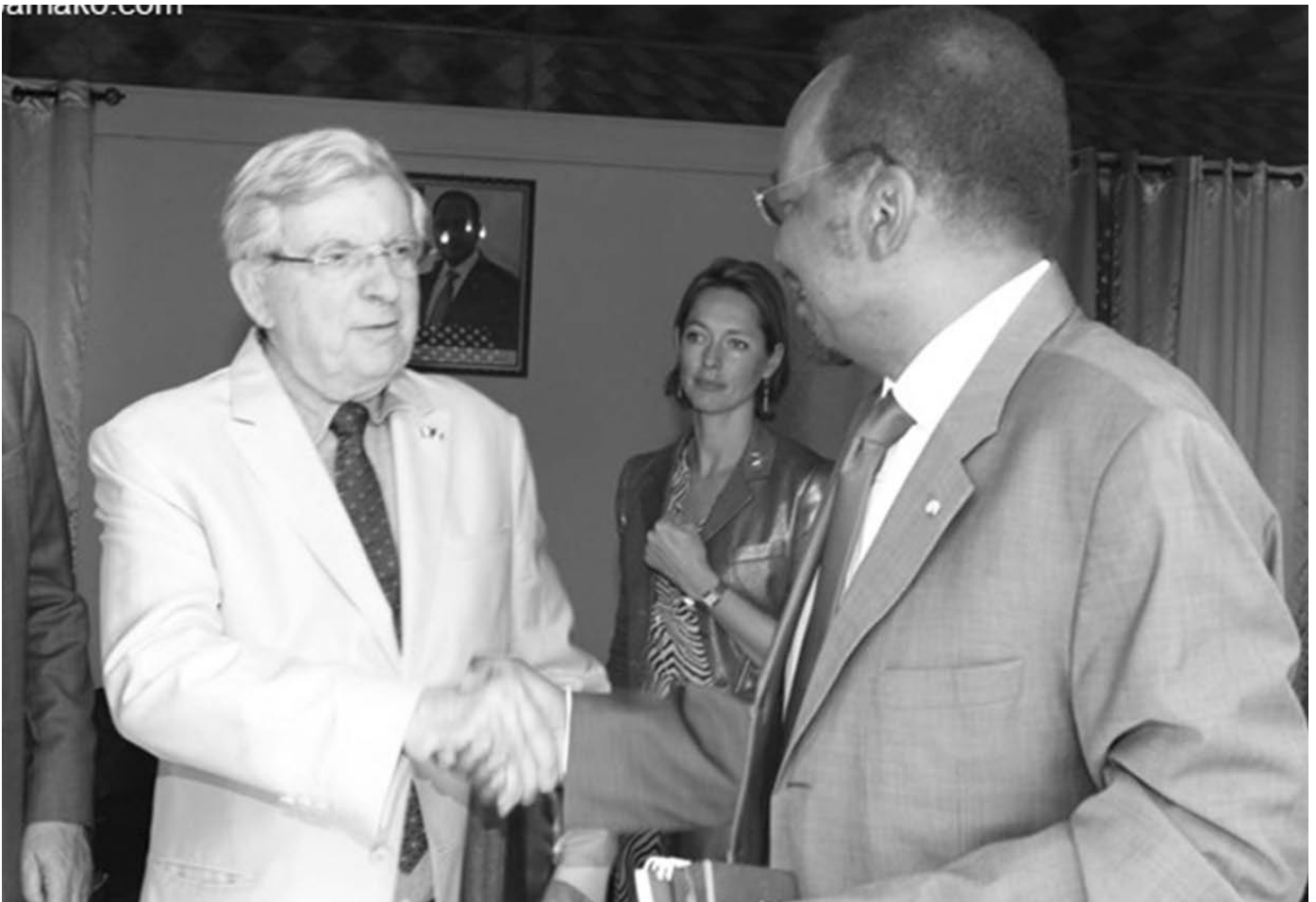
Le président malien par intérim recevant, l'ancien ministre de la Défense de François Mitterrand, Jean-Pierre Chevènement, à Bamako en février 2013.

mené d'opération militaire conjointe avec des groupes armés existant alors.» Si le COS a délibérément laissé le MNLA reprendre pied à Kidal avant d'y pénétrer, c'est donc simple affaire de savoir-vivre. Et si les hommes du MNLA servent de guide dans les massifs à la recherche des djihadistes et des otages, c'est pure promenade de courtoisie.