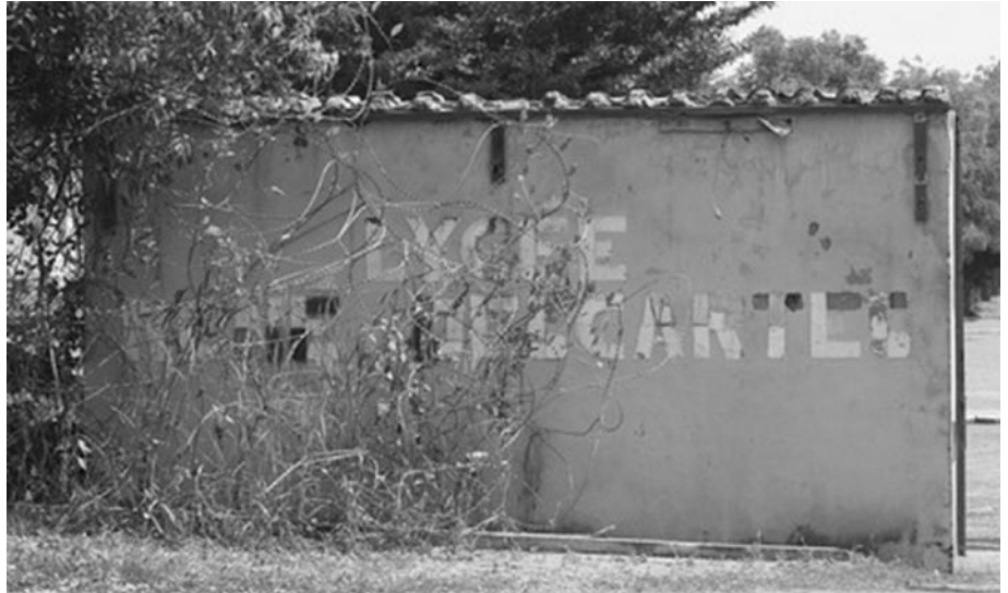
Le lycée français Descartes à Bouaké qui abritait le contingent français bombarbé à Bouaké le 6 novembre 2004