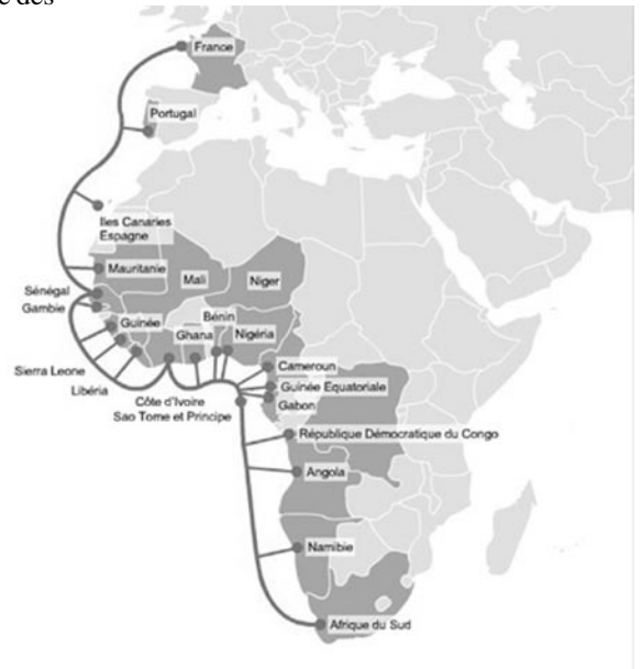
Le câble sous-marin ACE (Africa Coast to Europe) dessert 23 pays entre la France et l'Afrique du Sud.

Le premier appartient à un consortium majoritairement sud-africain. Le second appartient majoritairement à Orange et aboutit en Bretagne (à Penmarc'h). ACE dessert en particulier trois pays