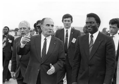
Le président français François Mitterrand, à Kigali (Rwanda), avec son homologue rwandais Juvénal Habyarimana, en décembre 1984.

Cette vision des choses, très largement partagée au sein de l'armée et à l'Élysée, sera particulièrement accentuée après l'effondrement de l'Union soviétique et l'hégémonie américaine qui en découle mécaniquement.