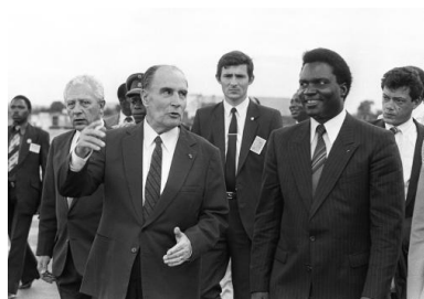
Le président français François Mitterrand, à Kigali (Rwanda), avec son homologue rwandais Juvénal Habyarimana, en décembre 1984.

« Des responsabilités lourdes et accablantes », mais pas de « complicité » au sens juridique: telle est la principale conclusion du rapport de la commission présidée par l'historien Vincent Duclert sur le rôle de la France face au génocide des Tutsis du Rwanda. C'est la première fois qu'un rapport officiel va aussi loin. Quelles suites politiques Emmanuel Macron, commanditaire du rapport, voudra-t-il donner à ce constat?