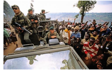
Des militaires français de la force Turquoise, en juillet 1994, dans la région de Butare.

prise en compte », observe le rapport du Duclert, qui conclut : « La DGSE n'est pas écoutée, elle est critiquée même. »