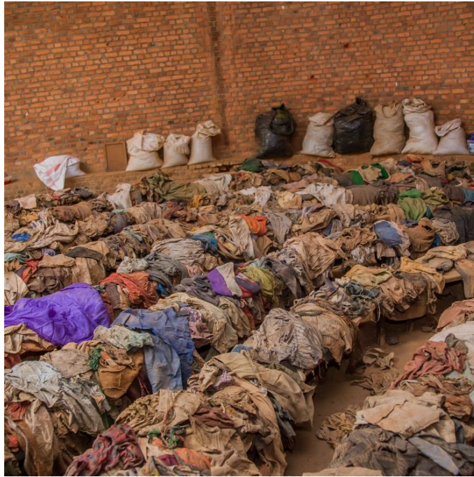
Intérieur de l'église de Nyamata, actuel mémorial de Nyamata, Rwanda. 2018.

présidence de la République française (1993) témoignant de la volonté du président François Mitterrand de poursuivre le soutien militaire français aux Forces armées rwandaises, un témoignage d'un ancien parachutiste au 3 e RPIMa, etc.