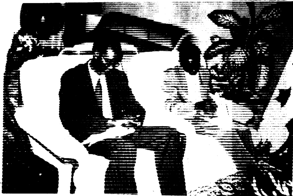
Uwo wambaye amadarubindi niwe ushinze itangazamakuru muri Perezidansi. Turamushimira ukuntu yadufashije mu kubonana n'abategetsi.

Minisitiri w'Ingabo ati : "Abo ba Pali-pehutu bazoze duhigire maze turabe umugabo n'igihunda".