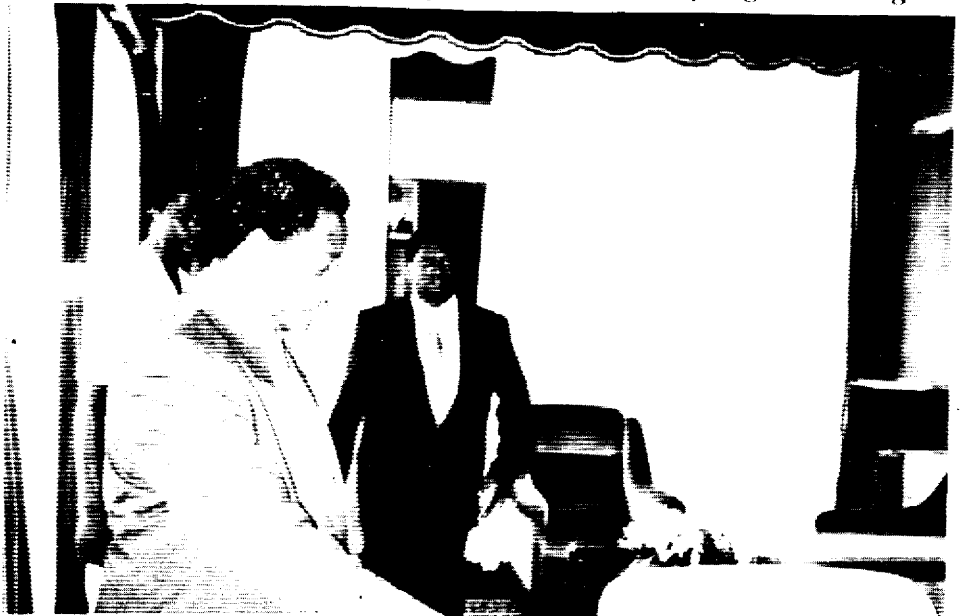
Perezida Ndadaye aje kwakira abanyamakuru ba Kangura. Uwo mugabo umwerekaga aho anyura niwe Ambassadeur muri Perezidansi.

ubufatanye bungana kuriya nibaramuka bafatanije mu kwihorera ku bibi bari barakorewe, hari utavugaga rumwe na Frodebu uzasigara? Rubanda nyamwinshi y'abarundi imaze gutahukana intsinzi, inziraguhemuka Melchior Ndadaye yasabye abayoboke be ko nta butegetsi buhora ngo butere kabiri. Abumvisha ko impamvu yatumye batsinda ari uko buri murundi yari akeneye kubona uburenganzira bwe, ko yari akeneye guhirika ingoma