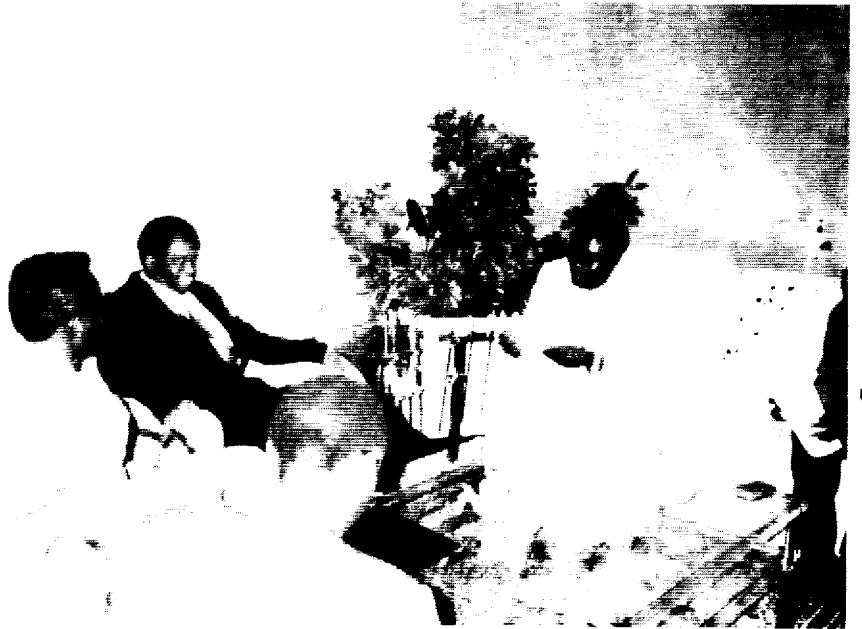
Perezida Ndadaye arasubiza ibibazo by'abanyamakuru.

Kugeza ubu, ahabayeho amatora hose, u Burundi nibwo