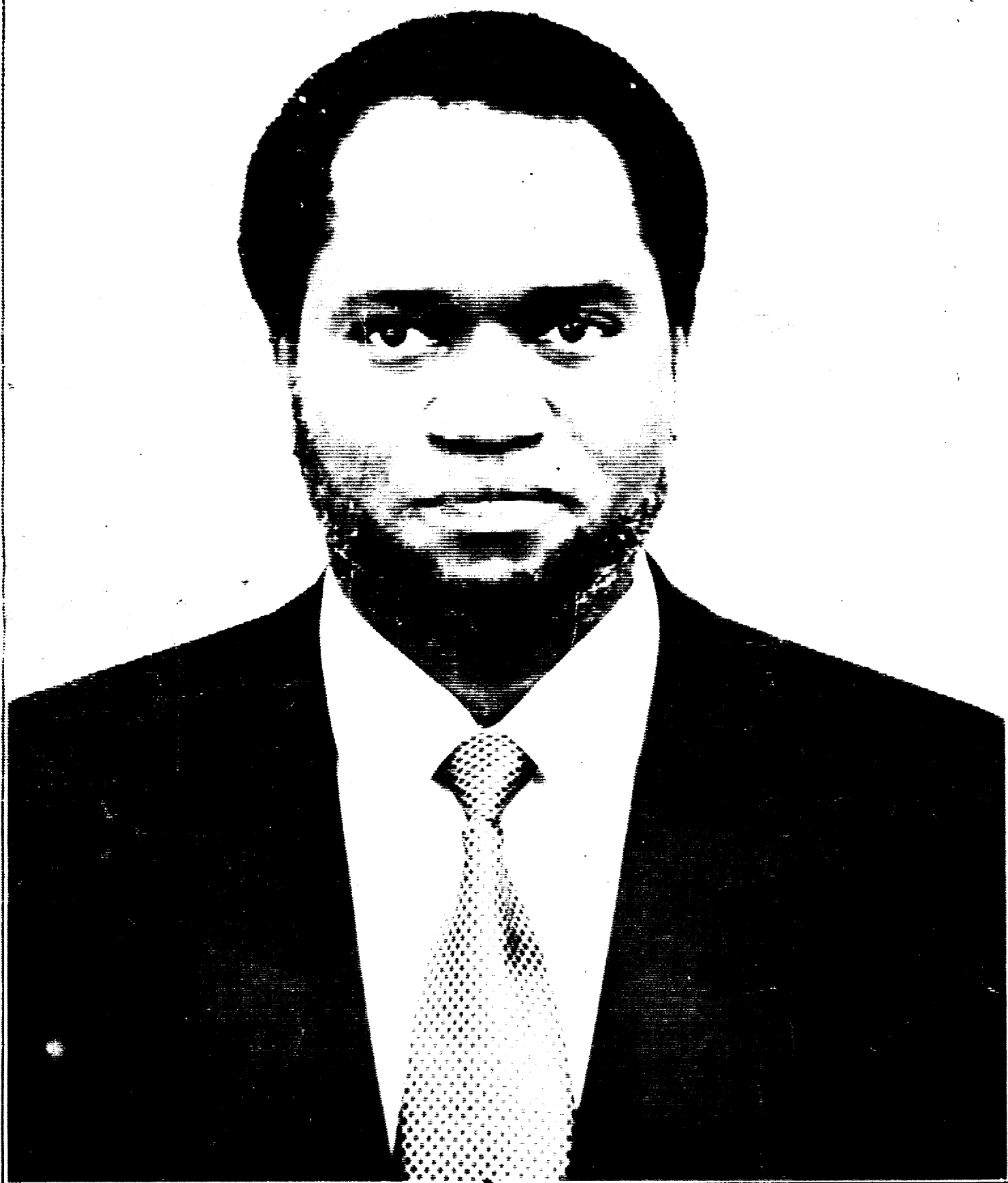
NDADAYE MELIKIYORO. INSHUNGU Y'U BURUNDI BUSHYASHYA.