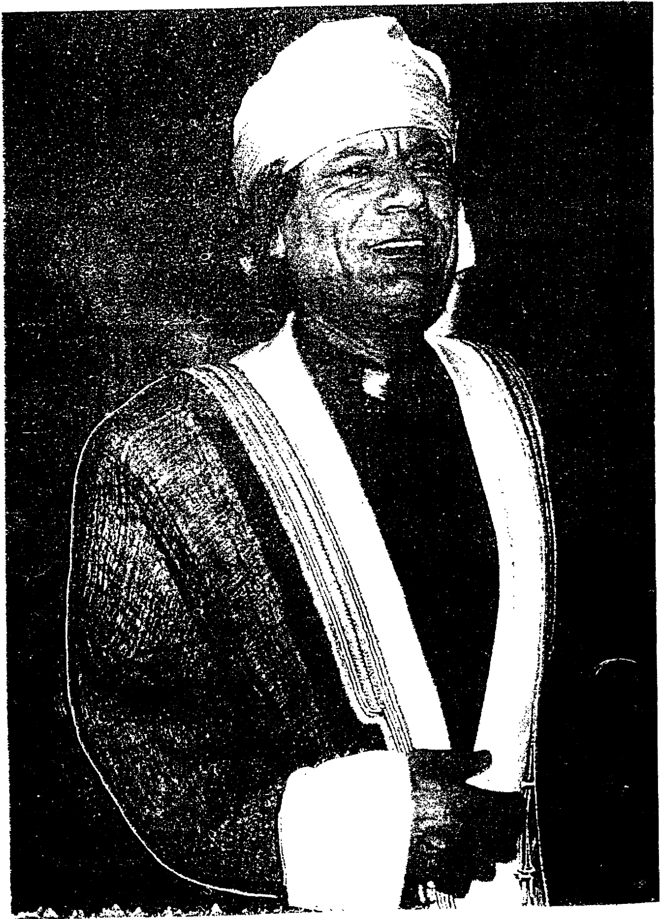
Le révolutionnaire KADDAFI Leader de la JAMAHILIYA ARABE - LYBIENNE