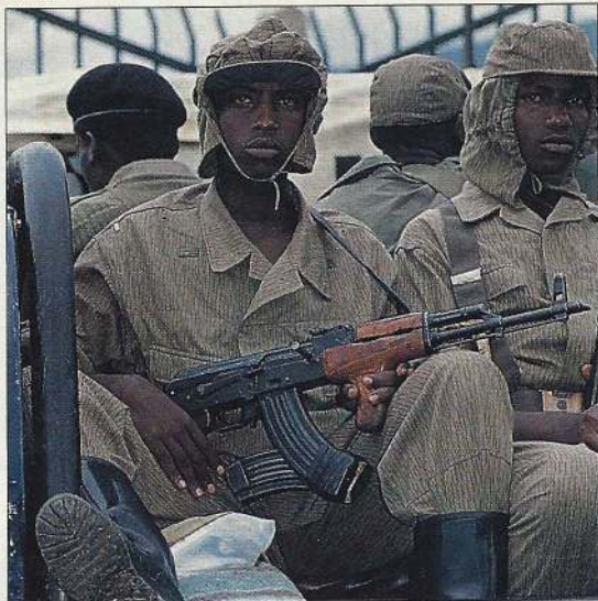
La présence d'un bataillon des rebelles du FPR installé dans l'enceinte même du Parlement à Kigali est l'un des aspects les plus insolites de la « drôle de paix » rwandaise. En bas : au détour du chemin, le camp de déplacés de Nyacyonga.