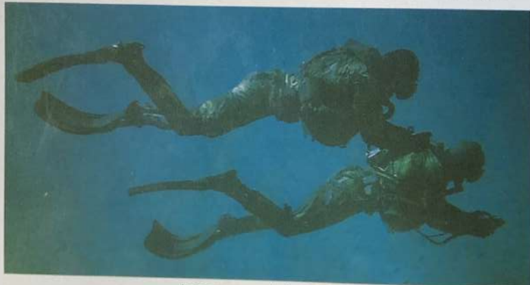
Les nageurs de la S.N.I.O.

Depuis 1945, le génie parachutiste a participé, sous des formes diverses, à tous les conflits dans lesquels la France a été engagée. Les sapeurs parachutistes du 17 e RGP sont les héritiers des propulsistes qui franchirent le Rhin le 31 mars 1945 et valurent au régiment l'inscription Germersheim 1945 sur les soies de son drapeau.