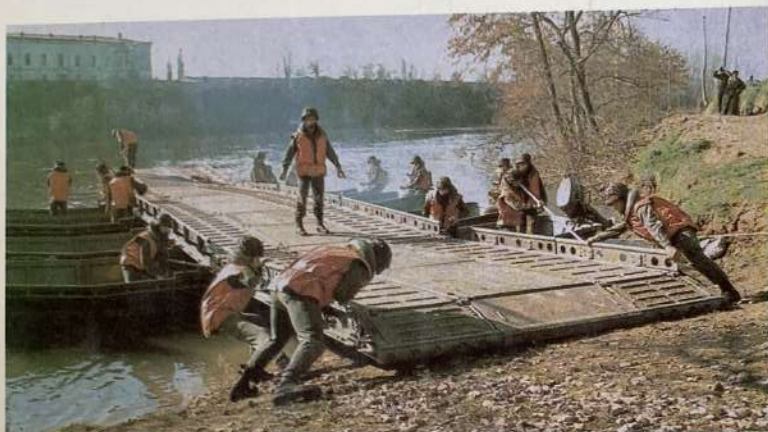
Activité de pontage.