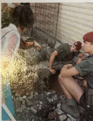
Les démineurs de l'espoir à Beyrouth.