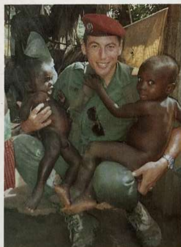
Action humanitaire en Afrique.