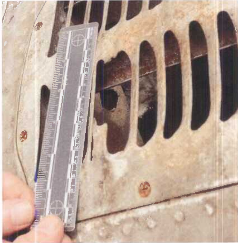
Impact de projectile de munition de petit calibre sur la ventilation génération APU