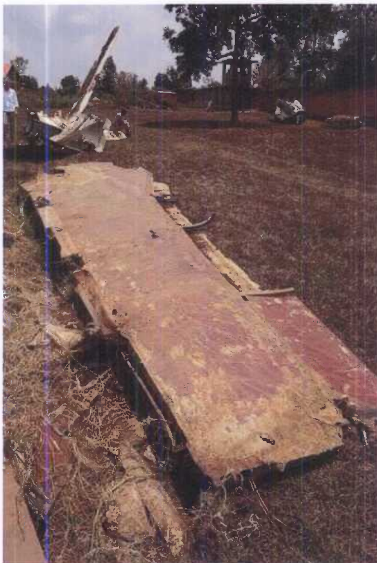
Vue du bout d'aile droite