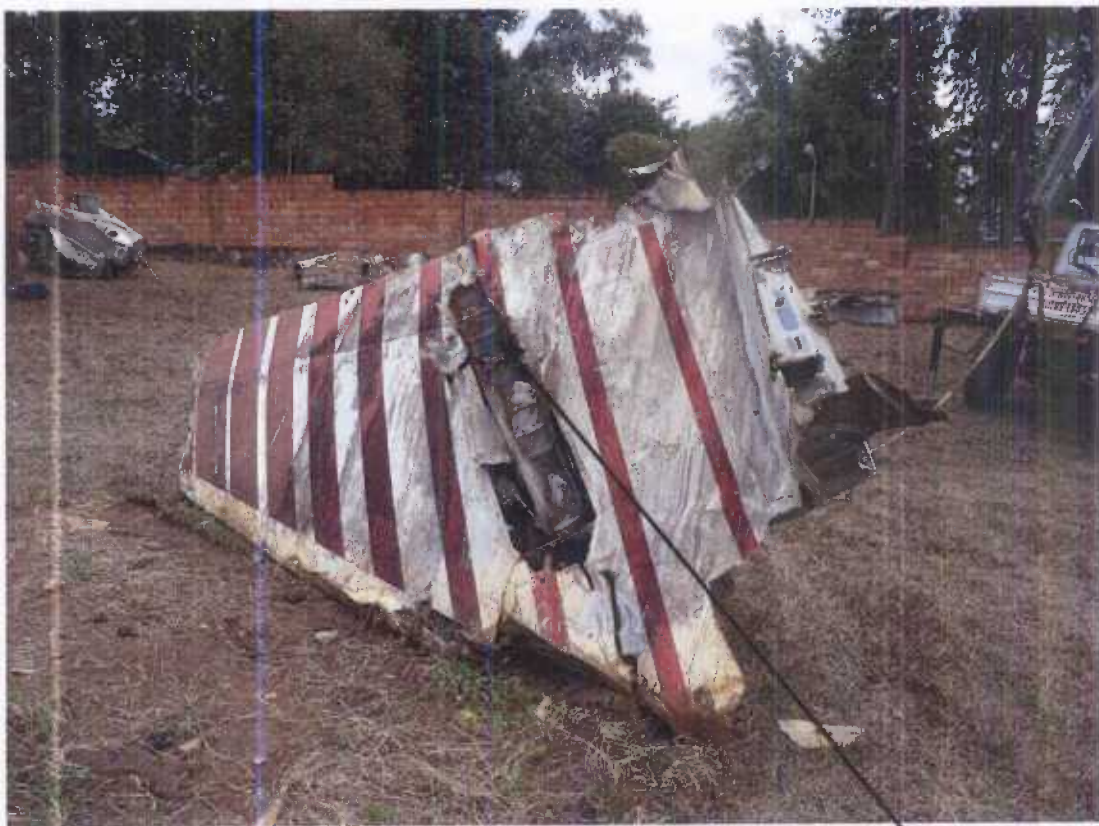
Base du plan fixe horizontal gauche