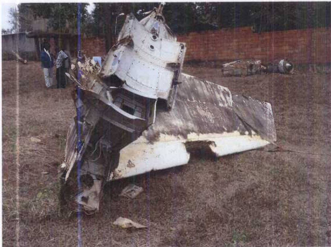
Empennage retourné pour les besoins de l'expertise