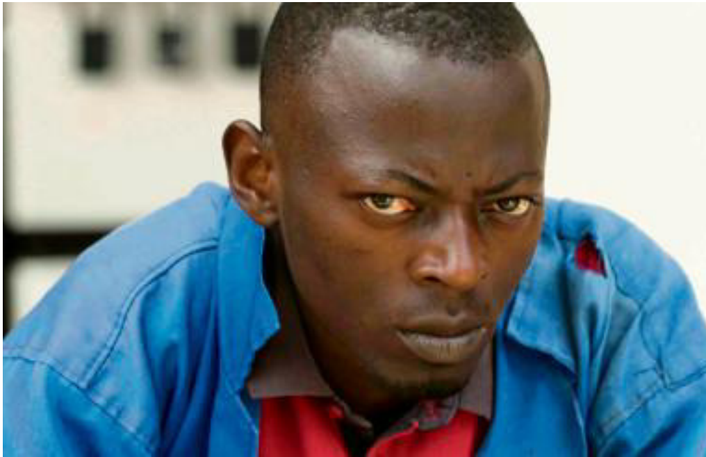
Image extraite du documentaire « Rwanda, vers l'apocalypse ». BABEL DOC

Enrichi par les mots de Gaël Faye, le documentaire s'intéresse donc à la période préparatoire. Les coréalisateurs (Michaël Sztanke, Seamus Haley et Maria Malagardis) distinguent cinq phases avant