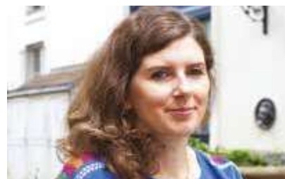
Camille Lefebvre © Pauline Rousseau