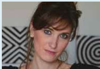
Héléne Dumas © D.R.