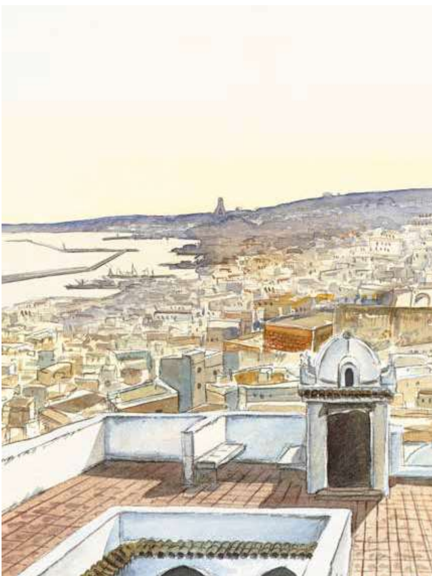
Suites algériennes . 1962-2019 © Jacques Ferrandez, Casterman

Jacques FERRANDEZ, scénariste et dessinateur de bandes dessinées