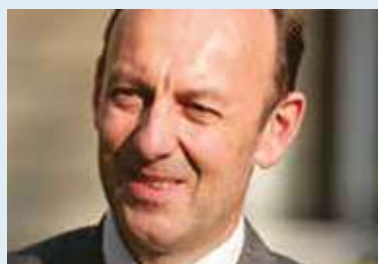
Vincent Duclert