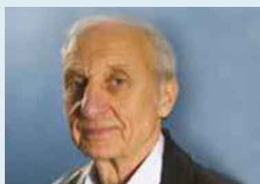
Jean Hatzfeld