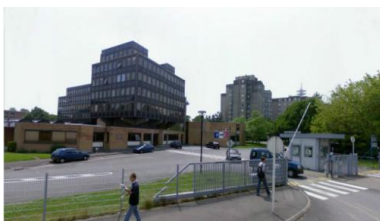
La Section de recherche de Villeneuve d'Ascq est basée dans les bureaux de l'état-major de la gendarmerie

K., qui « vendrait des armes de la catégorie A à des individus résidant dans le quartier du faubourg de Béthune », donne son téléphone et précise qu'il aurait encore « de nombreux contacts parmi les membres actifs » de son service. Le domicile de l'ancien flic sera finalement perquisitionné un an et demi plus tard.