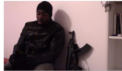
Amedy Coulibaly avec l'une des armes slovaques remilitarisées par le réseau lillois, dans sa vidéo posthume