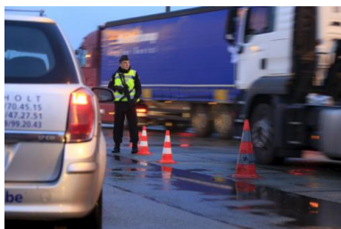
Un contrôle routier de gendarmerie, en 2015