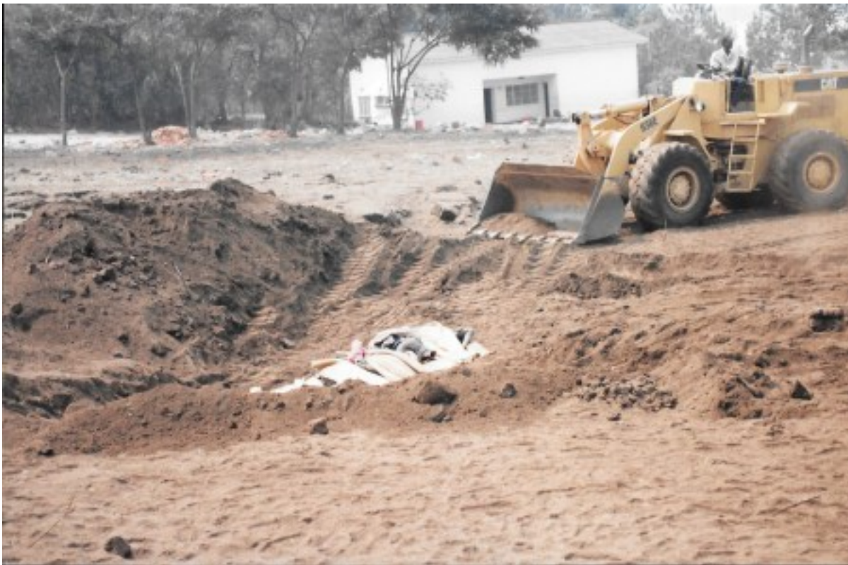
Goma épidémie de choléra – Fosses communes – droits réservés – reproduction interdite