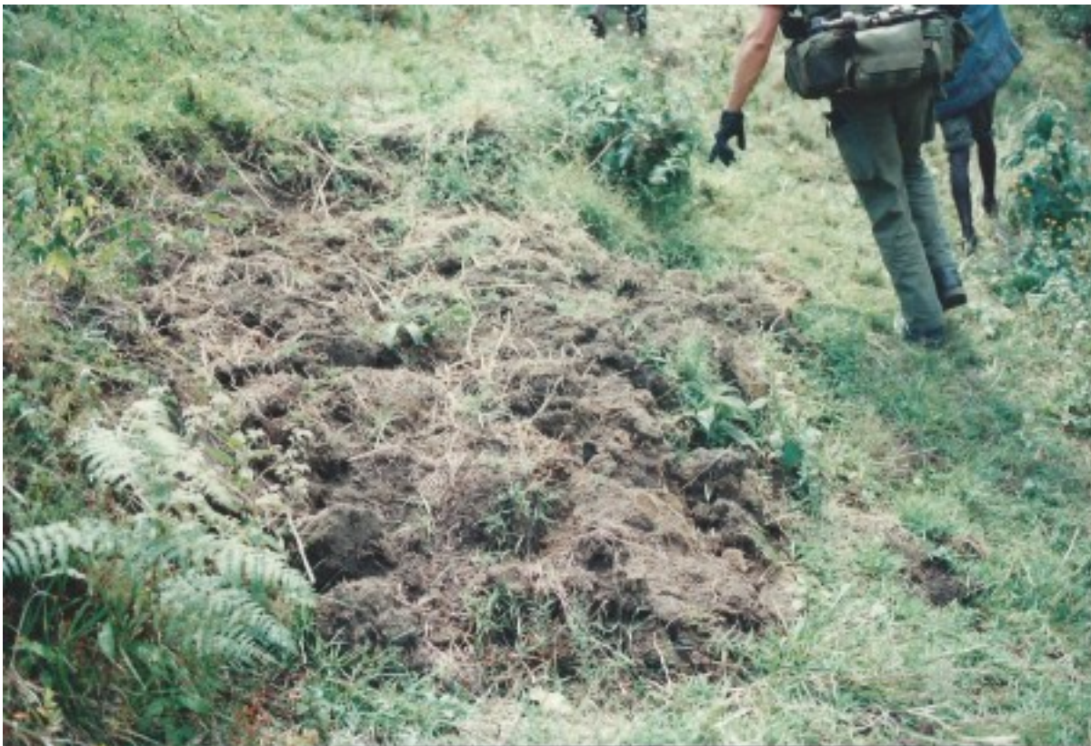
Fosses communes Bisesero 30 juin 1994