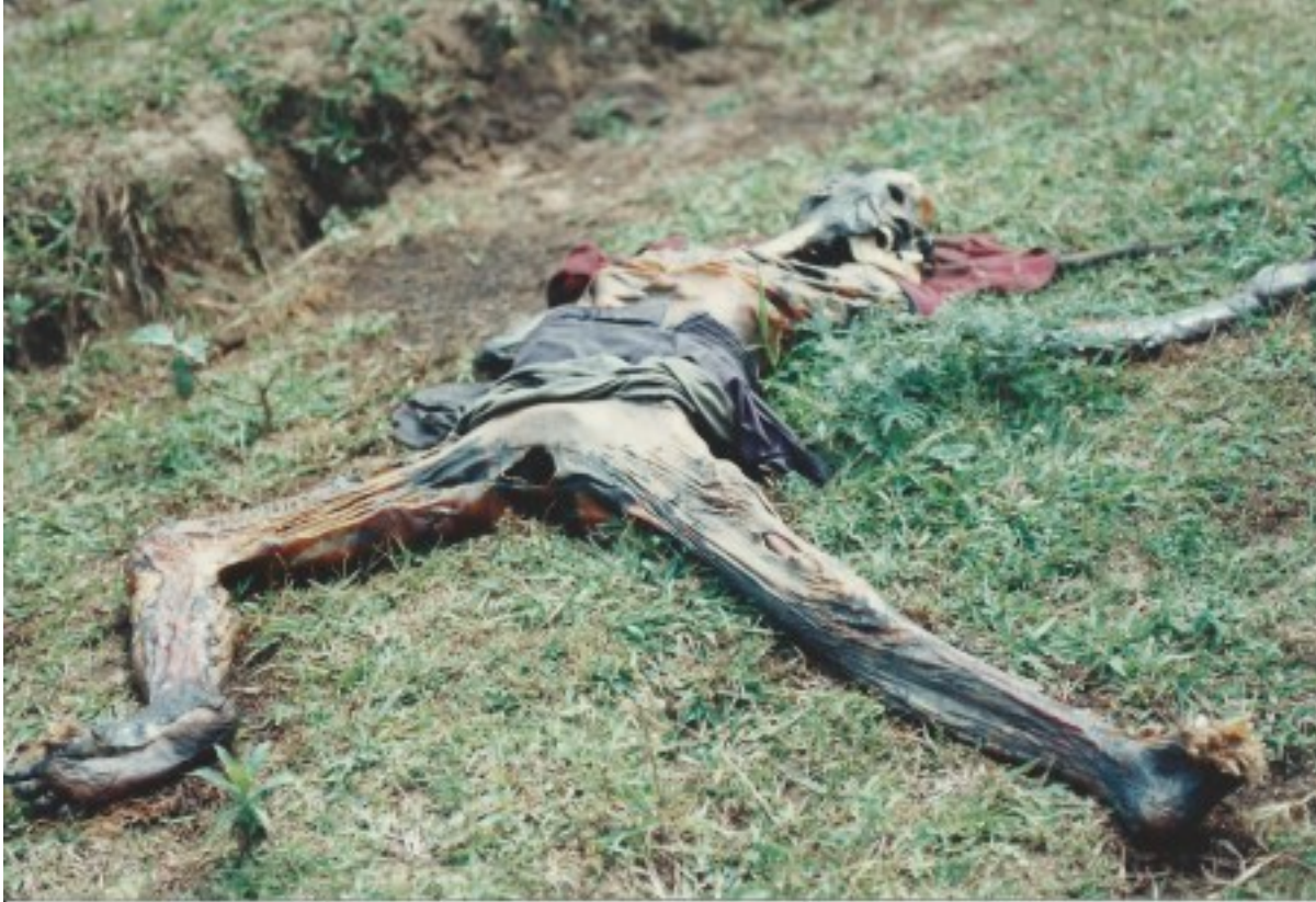
( https://bettersaferworld.files.wordpress.com/2014/04/numc3a9risation_20140519-12.jpg ). Charniers Bisesero 30 juin 1994 – droits réservés – reproduction interdite