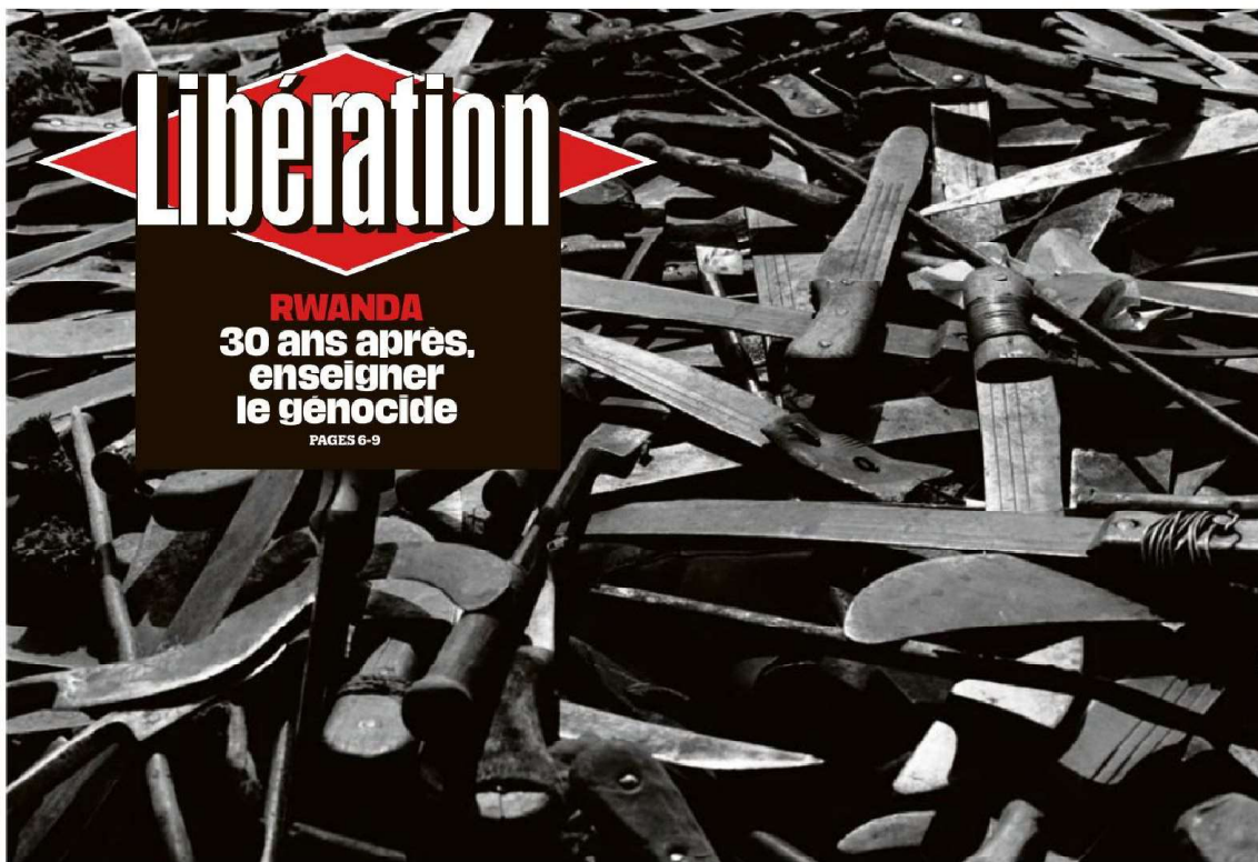
En 1994.

AUTAIN ET RUFFIN Comment ils préparent l'après-Mélenchon PAGES 12-13