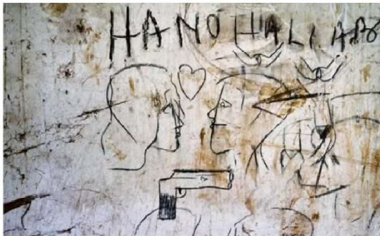
Des dessins sur les murs de la chapelle Saint-Joseph du séminaire Saint-Pie-X.