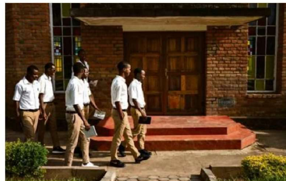
L'internat très prisé accueille 450 élèves du secondaire, exclusivement des garçons.