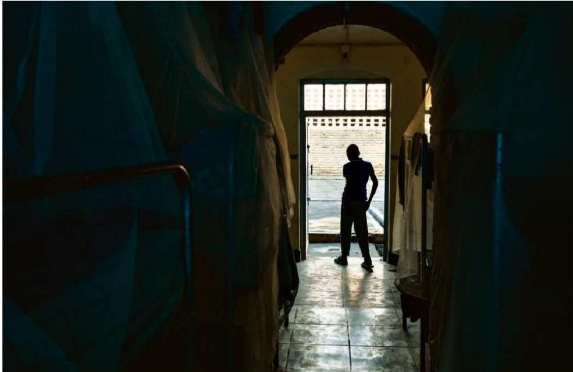
Plus de dix ans ont été nécessaires pour forger un nouveau récit national. Dans les dortoirs du petit séminaire de Nyundo, le 15 mars.