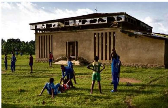
Une partie de foot devant la chapelle du petit séminaire de Nyundo, le 15 mars.