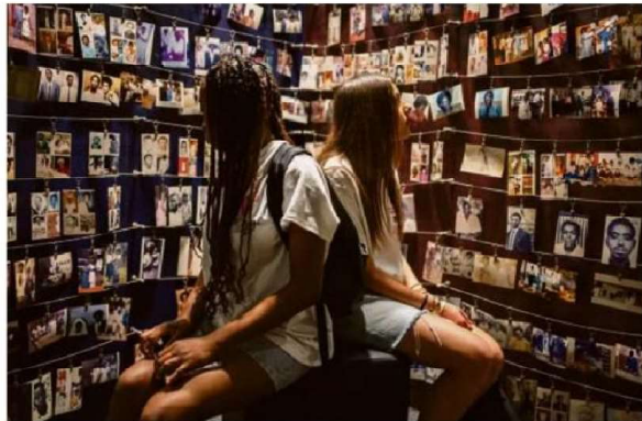
Des lycéennes françaises au Mémorial du génocide de Kigali, le 9 mars.