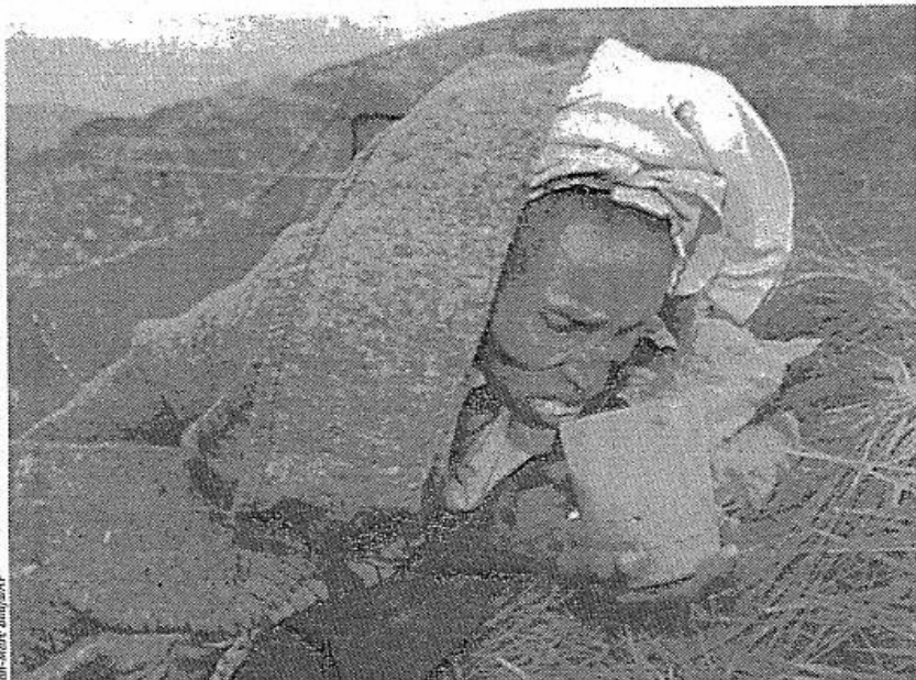
A Nyarushishi, samedi. Une femme tutsi, malade, se soigne avec du maïs dilué dans l'eau.